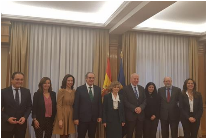
Ministerio de Empleo y Seguridad Social